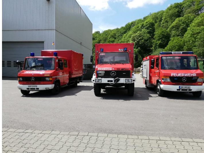
Drei Fahrzeuge stehen für die Grundfahrübungen bereit.

Im Jahr 2022 erfolgte keine Ausbildung im Rahmen des Feuerwehr-Führerschein, evtl. ist für das Jahr 2023 eine weitere Ausbildungsrunde geplant.