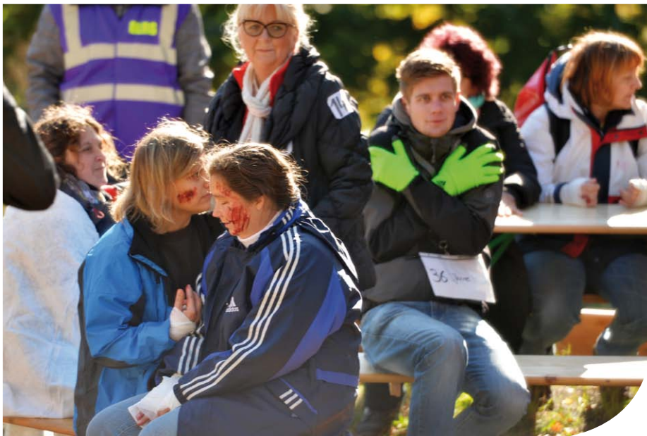
Geschminkt wie im Ernstfall: Bei der ersten und zweiten Vollübung des Projekts ENSURE trafen sich Laien und professionelle Rettungskräfte.